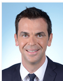
M. Olivier Véran Affaires sociales La République en Marche Isère 1 re