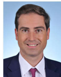
M. Olivier Becht Défense UDI et Indépendants Haut-Rhin 5 e