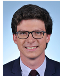
M. Pierre-Henri Dumont Affaires étrangères Les Républicains Pas-de-Calais 7 e