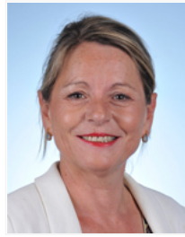
Mme Anne-Christine Lang Affaires culturelles et éducation La République en Marche Paris 10 e