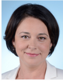
Mme Sylvia Pinel Finances

Libertés et Territoires Tarn-et-Garonne 2 e