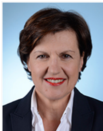
Mme Annie Genevard Affaires culturelles et éducation Les Républicains Doubs 5 e