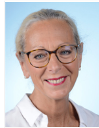
Mme Monique Limon Affaires sociales La République en Marche Isère 7 e