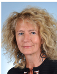
Mme Martine Wonner Affaires sociales La République en Marche Bas-Rhin 4 e