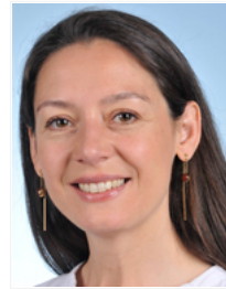
Mme Marie-Pierre Rixain Affaires culturelles et éducation