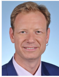
M. Pierre Dharréville Affaires sociales Gauche démocrate et républicaine Bouches-du-Rhône 13 e