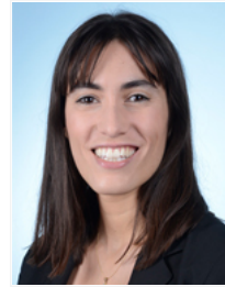
Mme Paula Forteza Lois La République en Marche Français établis hors de France 2 e