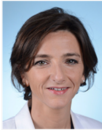
Mme Nathalie Elimas Affaires sociales Mouvement Démocrate et apparentés Val-d'Oise 6 e