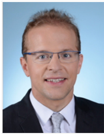
M. Thibault Bazin Défense Les Républicains Meurthe-et-Moselle 4 e