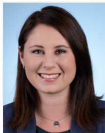
Mme Marine Brenier Affaires sociales Les Républicains Alpes-Maritimes 5 e